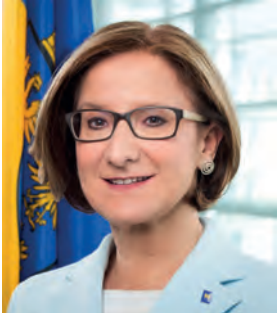
Mag.ª Johanna Mikl-Leitner Landeshauptfrau Niederösterreich

Als Landeshauptfrau von Niederösterreich freut es mich, dass in unserem Bundesland das Miteinander und die Solidarität der Generationen sehr stark gelebt werden. Das Land NÖ setzt zahlreiche Initiativen, um den Dialog der Generationen zu fördern. Der 3. Lehrgang der SeniorInnenUNI an der IMC Fachhochschule Krems verdeutlicht sowohl den hohen Stellenwert des lebenslangen Lernens, als auch den Kompetenzaufbau für ehrenamtliches Engagement und des Brückenschlags zwischen den Generationen in Niederösterreich.